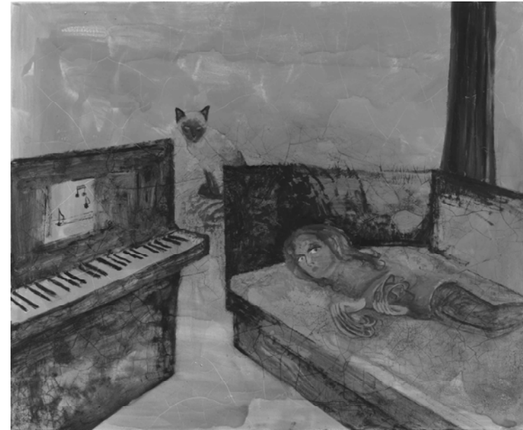
Amelie von Wulffen, ohne Titel , 2016, oil on canvas, 39.4 × 47.2 in.

in this performance the process of acculturation—the transmission of a staid respect for the arts. Wulffen creates a disjunction in the image by replacing the background with a scene from the nineteenth century (likely also by Defregger), thereby alluding to the alienation and estrangement involved in the Wulffens' musical education. In a second painting, Wulffen depicts herself as a child, lying on a sofa beside a piano, seemingly paralyzed by existential nausea. Her fingernails have grown out to obscenely long curls, making it impossible for her to practice the music lesson that awaits her above the keyboard. In depicting these episodes alluding to her upbringing, Wulffen illustrates the way one comes to both conform to and reject the society one finds oneself a part of. If every return to childhood entails a return to one's social origins, it also allows one to see the place from which one comes for what it is. The empty language used to describe one's roots—the country one is born in, said to be from, the culture one belongs to—is made tangible in the self as it was shaped in childhood. All these things exert their influence, sometimes imperceptibly, as if from a great distance.